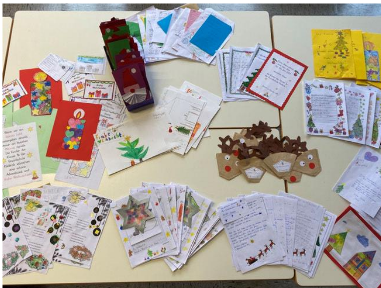
Abbildung 2: Rentiere als Briefumschlag

Grundschule Kleibrok (2020). Briefe und Bilder gegen Einsamkeit. https://www.gs-kleibrok.de/2020/12/16/briefe-und-bilder-gegen-einsamkeit/ [01.04.2024].